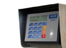
Docházkový terminál RT320 je možno doplnit nerezovým venkovním krytem (KRYT_RT).